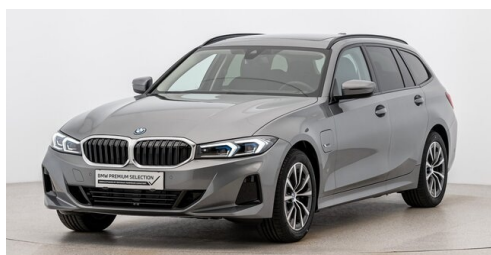
Höglinger Denzel GesmbH - Linz - www.bmw-hoeglinger.at