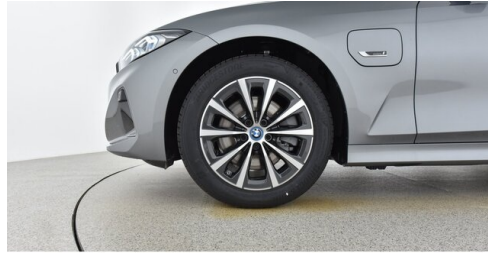
Höglinger Denzel GesmbH - Linz - www.bmw-hoeglinger.at