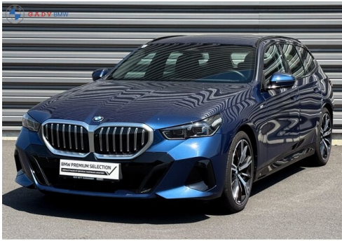
Migliore del GADY Family