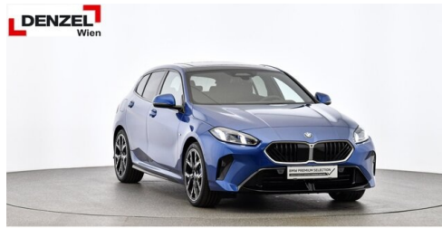
Wolfgang Denzel AG - Kundencenter Erdberg - www.denzel.at