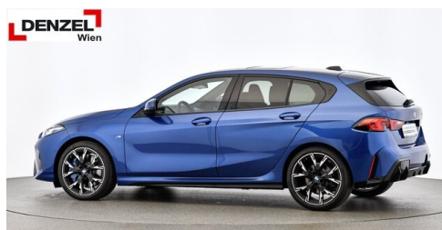
Wolfgang Denzel AG - Kundencenter Erdberg - www.denzel.at