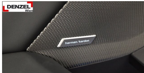
Wolfgang Denzel AG - Kundencenter Erdberg - www.denzel.at