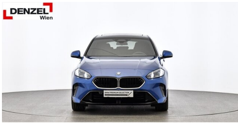
Wolfgang Denzel AG - Kundencenter Erdberg - www.denzel.at