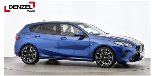
Wolfgang Denzel AG - Kundencenter Erdberg - www.denzel.at