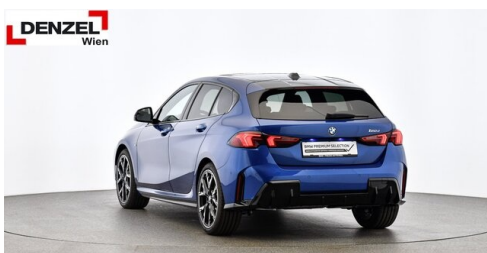
Wolfgang Denzel AG - Kundencenter Erdberg - www.denzel.at