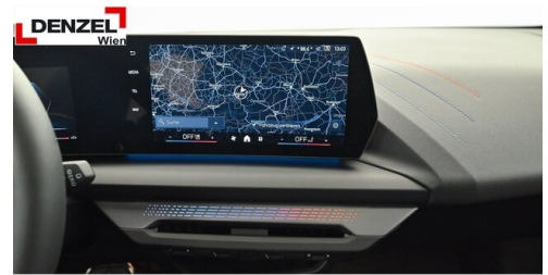
Wolfgang Denzel AG - Kundencenter Erdberg - www.denzel.at