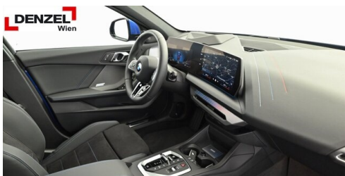
Wolfgang Denzel AG - Kundencenter Erdberg - www.denzel.at