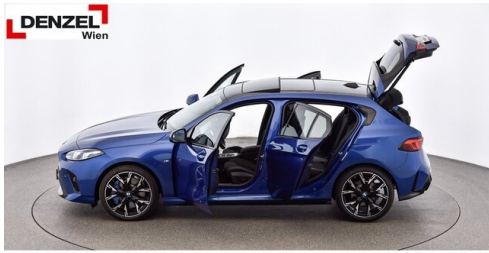
Wolfgang Denzel AG - Kundencenter Erdberg - www.denzel.at