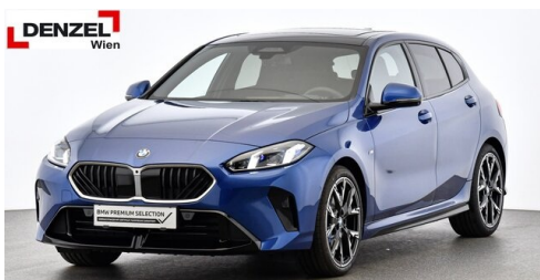
Wolfgang Denzel AG - Kundencenter Erdberg - www.denzel.at