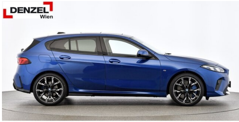
Wolfgang Denzel AG - Kundencenter Erdberg - www.denzel.at