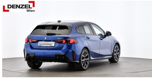
Wolfgang Denzel AG - Kundencenter Erdberg - www.denzel.at