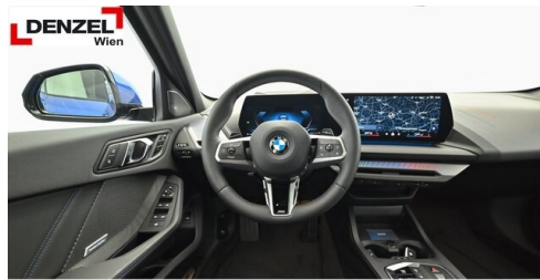
Wolfgang Denzel AG - Kundencenter Erdberg - www.denzel.at