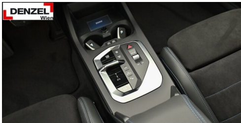
Wolfgang Denzel AG - Kundencenter Erdberg - www.denzel.at