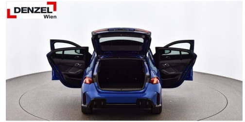
Wolfgang Denzel AG - Kundencenter Erdberg - www.denzel.at