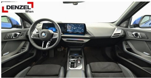
Wolfgang Denzel AG - Kundencenter Erdberg - www.denzel.at