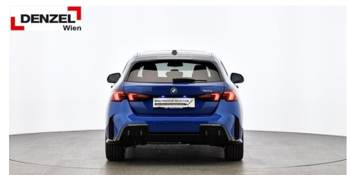
Wolfgang Denzel AG - Kundencenter Erdberg - www.denzel.at