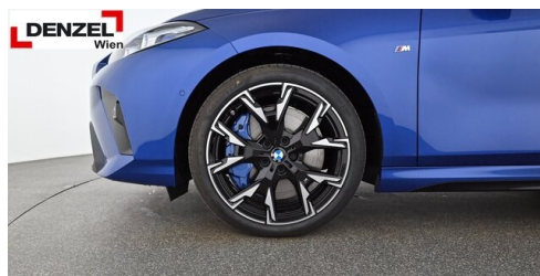
Wolfgang Denzel AG - Kundencenter Erdberg - www.denzel.at