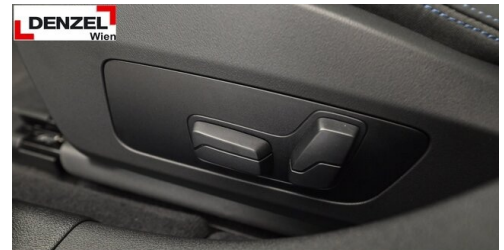
Wolfgang Denzel AG - Kundencenter Erdberg - www.denzel.at