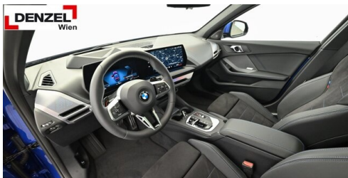
Wolfgang Denzel AG - Kundencenter Erdberg - www.denzel.at