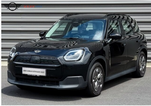
Mitglied der GADV Family