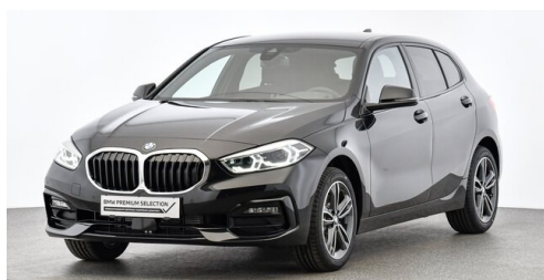
Höglinger Denzel GesmbH - Linz - www.bmw-hoeglinger.at