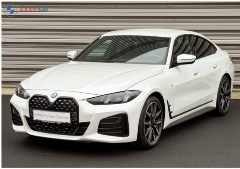
Mitglied der GADV Family