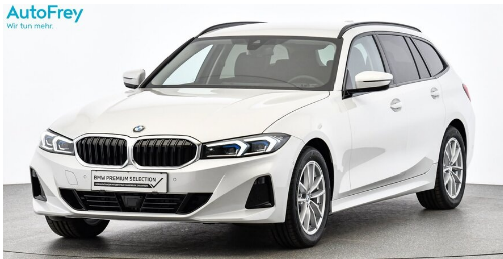
AutoFrey - Villach - www.autofrey.at