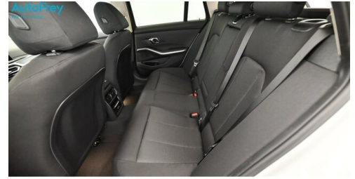
AutoFrey - Villach - www.autofrey.at