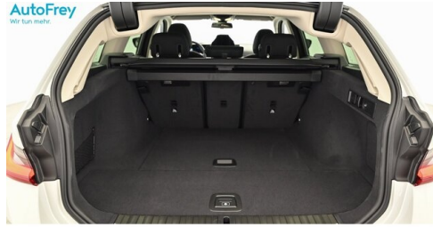
AutoFrey - Villach - www.autofrey.at