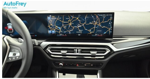
AutoFrey - Villach - www.autofrey.at