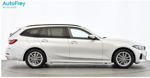
AutoFrey - Villach - www.autofrey.at