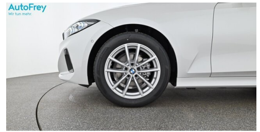
AutoFrey - Villach - www.autofrey.at