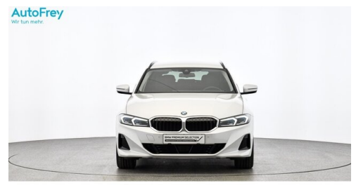
AutoFrey - Villach - www.autofrey.at