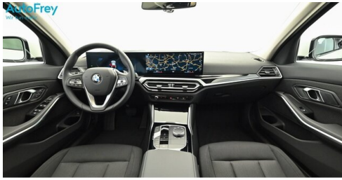
AutoFrey - Villach - www.autofrey.at