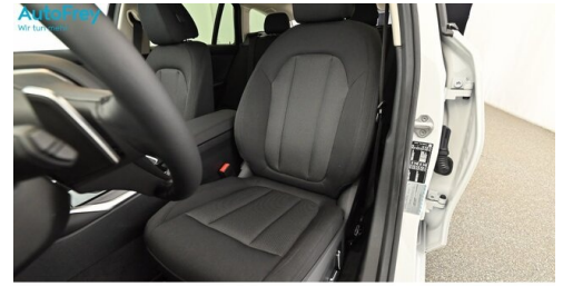
AutoFrey - Villach - www.autofrey.at