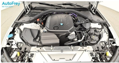
AutoFrey - Villach - www.autofrey.at