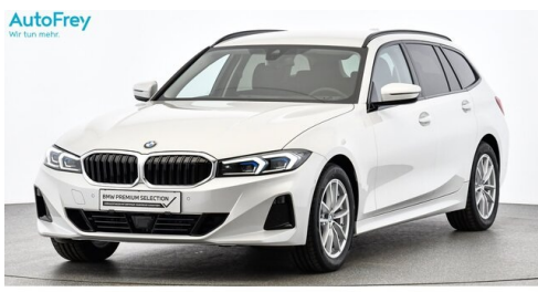
AutoFrey - Villach - www.autofrey.at