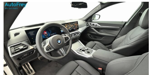
AutoFrey- Salzburg - www.autofrey.at