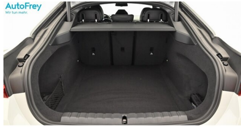
AutoFrey- Salzburg - www.autofrey.at