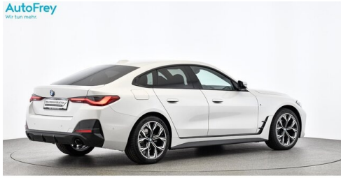
AutoFrey- Salzburg - www.autofrey.at