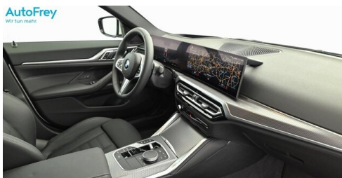
AutoFrey- Salzburg - www.autofrey.at