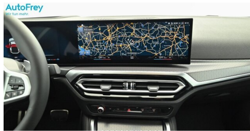
AutoFrey- Salzburg - www.autofrey.at