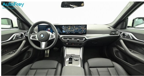
AutoFrey- Salzburg - www.autofrey.at