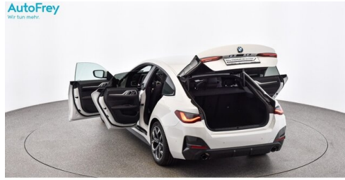
AutoFrey- Salzburg - www.autofrey.at