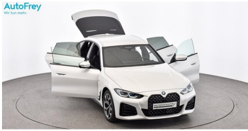
AutoFrey- Salzburg - www.autofrey.at