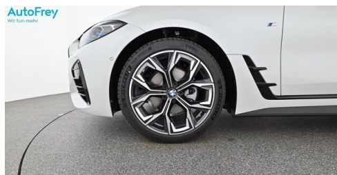
AutoFrey- Salzburg - www.autofrey.at

(1) Die angegebenen Werte über Kraftstoffverbrauch und CO 2 -Emissionen wurden nach den vorgeschriebenen Messverfahren gem. VO (EG) 715/2007 ermittelt. Als Basis für die Verbrauchsermittlung gilt der ECE-Fahrzyklus (NEFZ). Dieser setzt sich aus ca. einem Drittel Fahrt innerorts und zwei Drittel außerorts (gemessen an der Wegstrecke) zusammen. Zusätzlich zum Verbrauch wird die CO 2 -Emission gemessen.