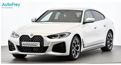
AutoFrey- Salzburg - www.autofrey.at