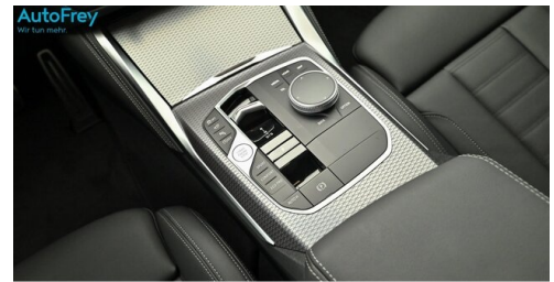
AutoFrey- Salzburg - www.autofrey.at