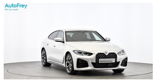
AutoFrey- Salzburg - www.autofrey.at