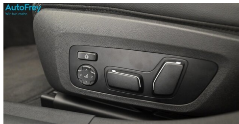
AutoFrey- Salzburg - www.autofrey.at