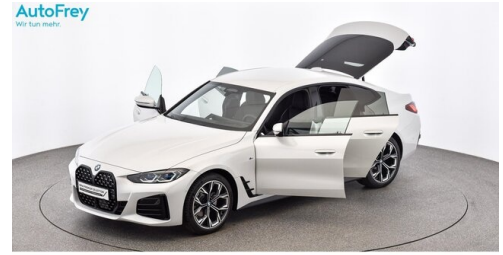
AutoFrey- Salzburg - www.autofrey.at