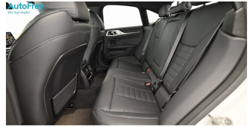
AutoFrey- Salzburg - www.autofrey.at