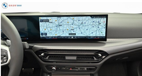
Mitgeliefert von GADY Family