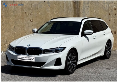
Miglior del GADV Family