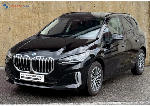
Mitglied der GADY Family