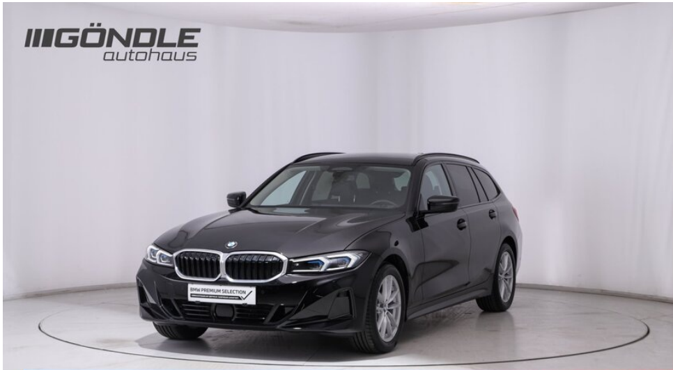
Göndle - St. Pölten