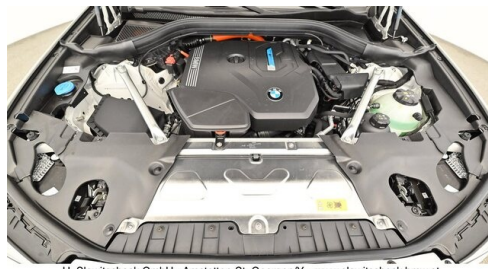
H. Slawitscheck GmbH - Amstetten-St. Georgen/Y. - www.slawitscheck.bmw.at