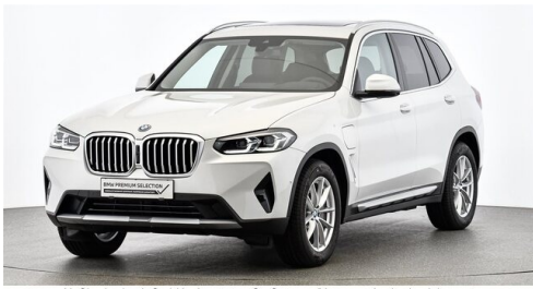
H. Slawitscheck GmbH - Amstetten-St. Georgen/Y. - www.slawitscheck.bmw.at