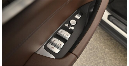
H. Slawitscheck GmbH - Amstetten-St. Georgen/Y. - www.slawitscheck.bmw.at