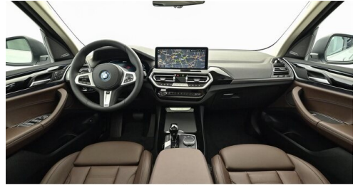
H. Slawitscheck GmbH - Amstetten-St. Georgen/Y. - www.slawitscheck.bmw.at