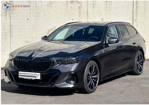
Miglius der GADY Family