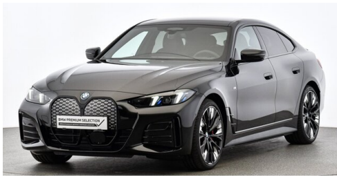
Bierbaum GmbH - Eisenstadt - www.bmw-bierbaum.at