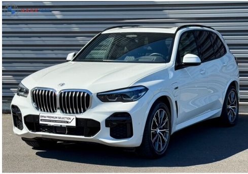
Mitglied der GADV Family