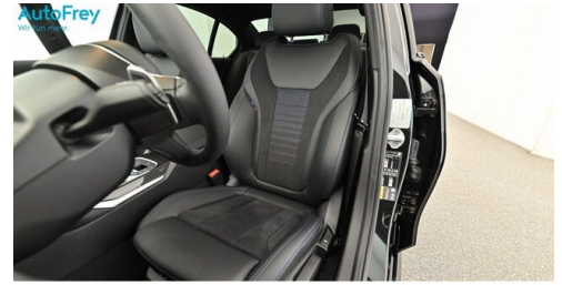
AutoFrey - Villach - www.autofrey.at