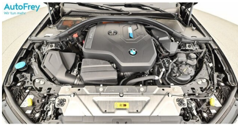
AutoFrey - Villach - www.autofrey.at