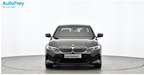
AutoFrey - Villach - www.autofrey.at