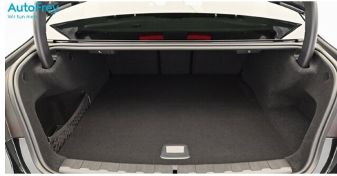
AutoFrey - Villach - www.autofrey.at