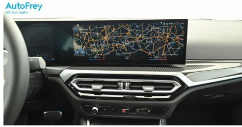
AutoFrey - Villach - www.autofrey.at