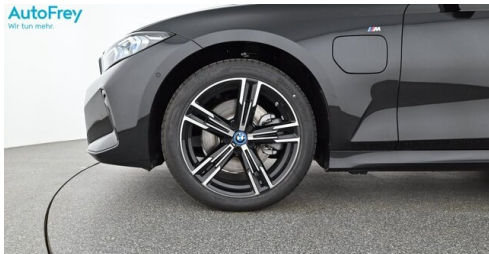
AutoFrey - Villach - www.autofrey.at