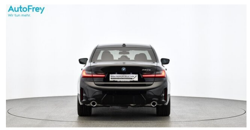
AutoFrey - Villach - www.autofrey.at