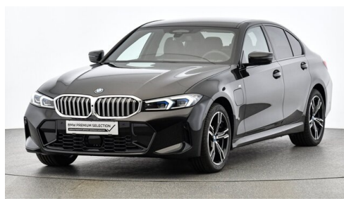
AutoFrey - Villach - www.autofrey.at