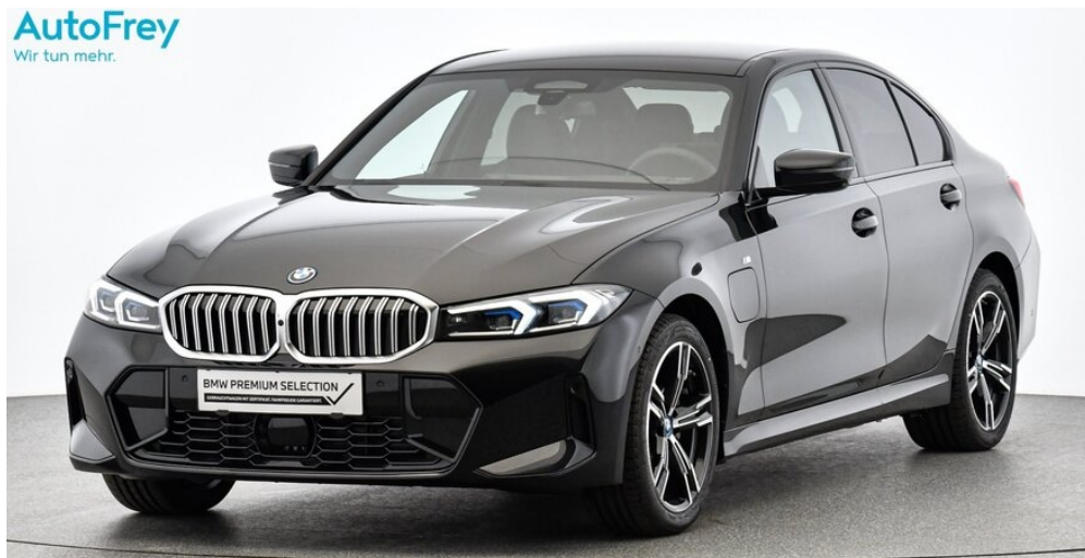
AutoFrey - Villach - www.autofrey.at