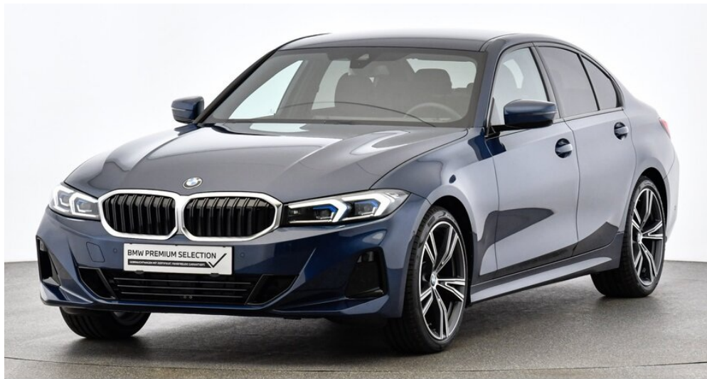
Hans Geyrhofer & Sohn GesmbH - Wels - www.geyrhofer.bmw.at