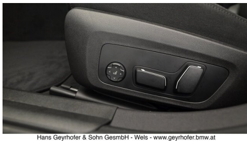
Hans Geyrhofer & Sohn GesmbH - Wels - www.geyrhofer.bmw.at