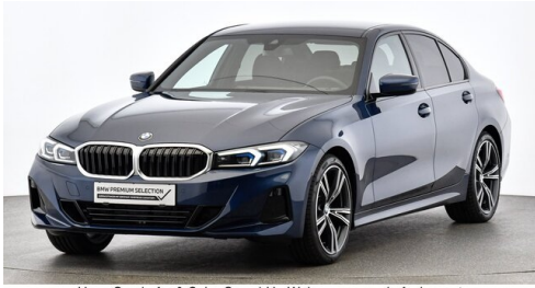
Hans Geyrhofer & Sohn GesmbH - Wels - www.geyrhofer.bmw.at