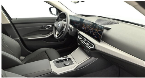
Denzel Krems GmbH www.denzel.at