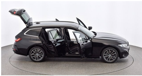
Denzel Krems GmbH www.denzel.at