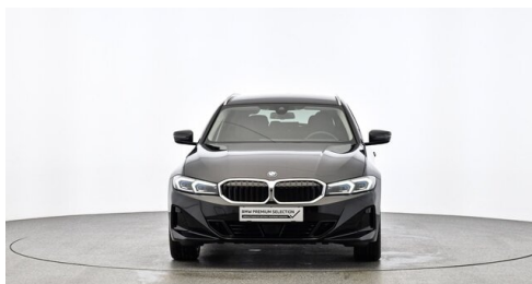
Denzel Krems GmbH www.denzel.at