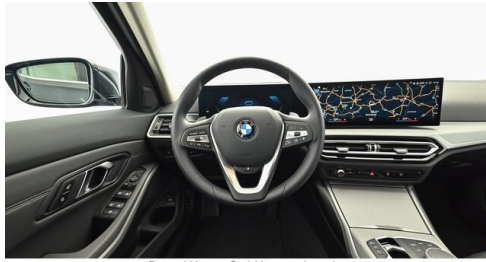
Denzel Krems GmbH www.denzel.at