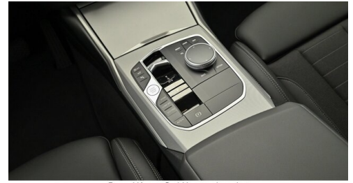
Denzel Krems GmbH www.denzel.at