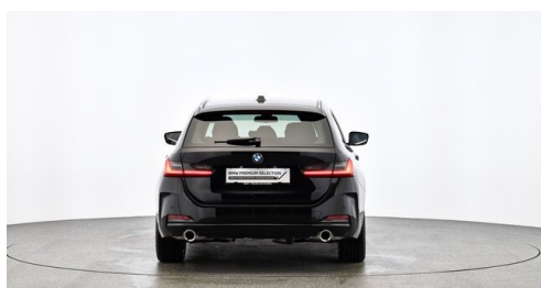
Denzel Krems GmbH www.denzel.at