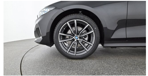
Denzel Krems GmbH www.denzel.at