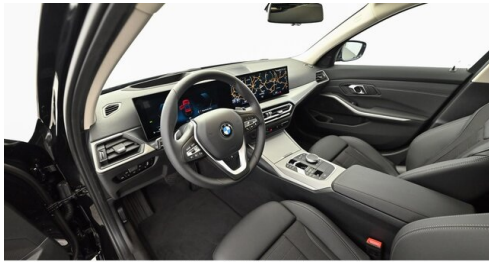
Denzel Krems GmbH www.denzel.at