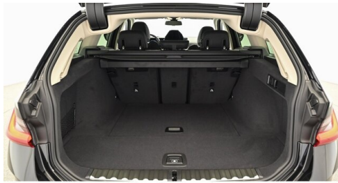
Denzel Krems GmbH www.denzel.at