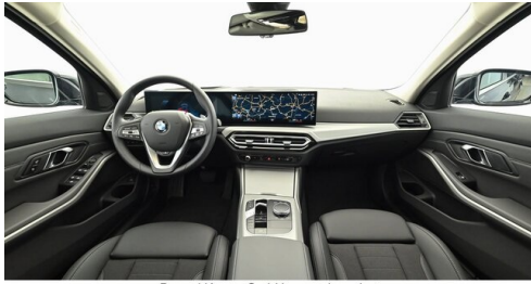
Denzel Krems GmbH www.denzel.at