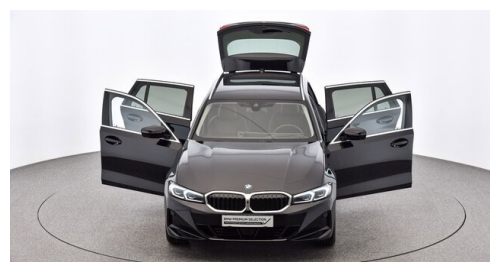
Denzel Krems GmbH www.denzel.at