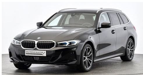
Denzel Krems GmbH www.denzel.at