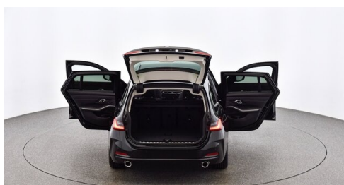
Denzel Krems GmbH www.denzel.at