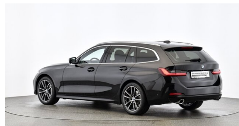
Denzel Krems GmbH www.denzel.at