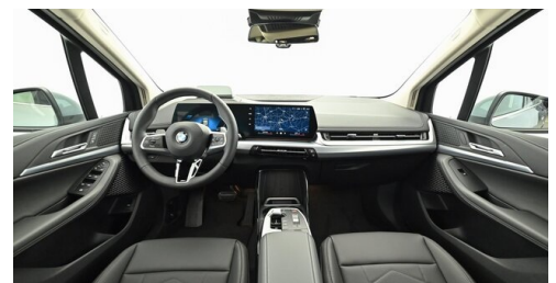
Denzel Krems GmbH www.denzel.at