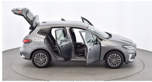
Denzel Krems GmbH www.denzel.at