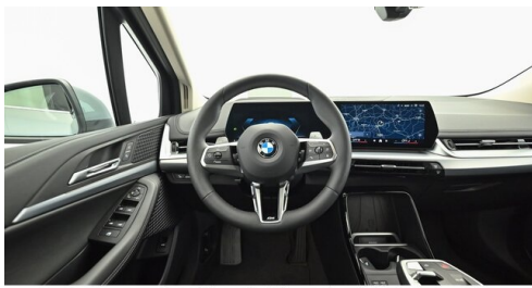
Denzel Krems GmbH www.denzel.at