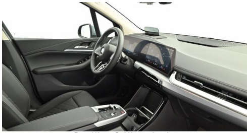
Denzel Krems GmbH www.denzel.at