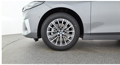
Denzel Krems GmbH www.denzel.at