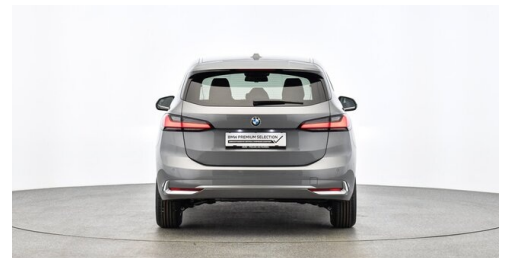
Denzel Krems GmbH www.denzel.at