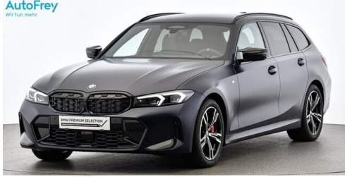
AutoFrey - St.Veit - www.autofrey.at