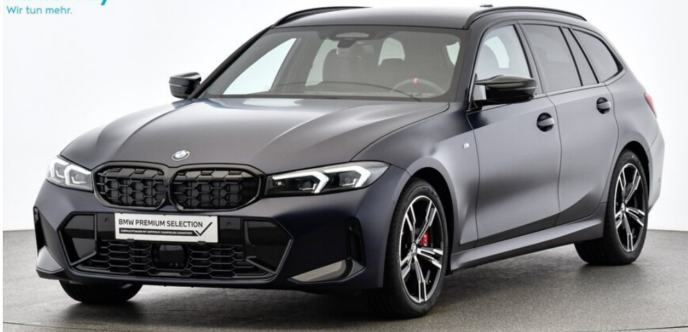
AutoFrey - St.Veit - www.autofrey.at