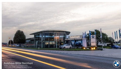
Autohaus BMW Reichhart Weg 2, 2204 6, 4319 Mauthausen +43 72 22 21584 | www.bmw-reichhart.at