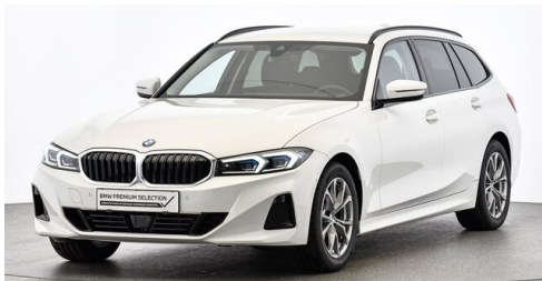
Höglinger Denzel GesmbH - Linz - www.bmw-hoeglinger.at