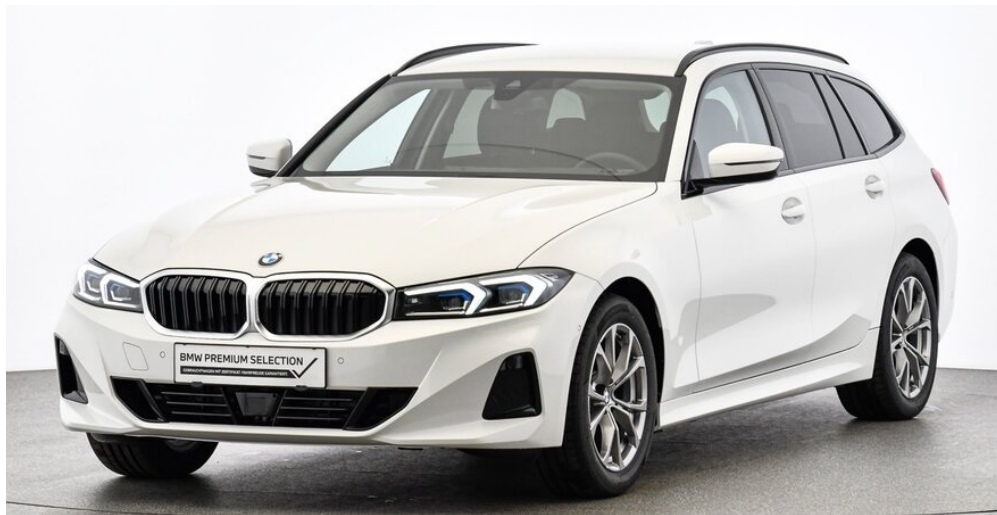
Höglinger Denzel GesmbH - Linz - www.bmw-hoeglinger.at