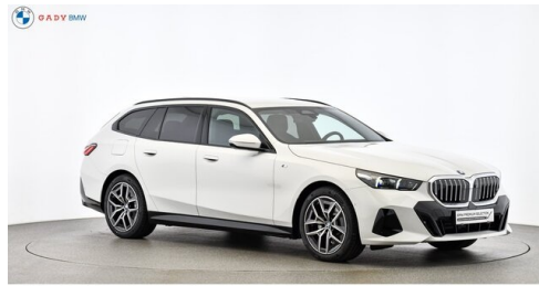
Mitglied der GADV Family