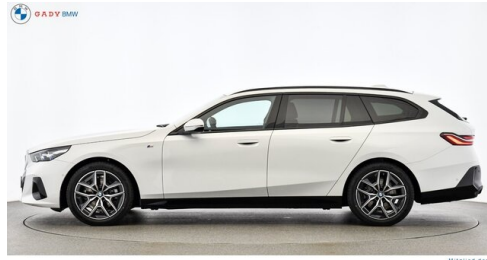
Mitglied der GADV Family