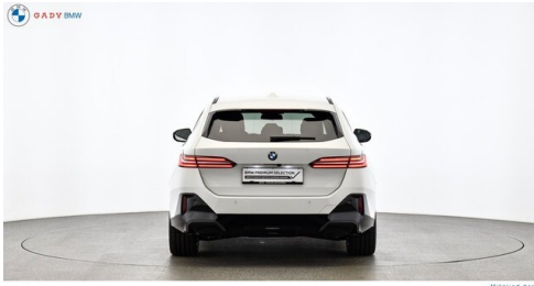
Mitglied der GADV Family