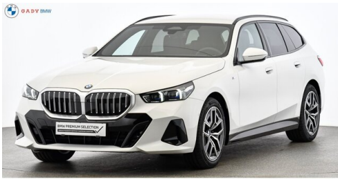
Mitglied der GADV Family