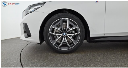
Mitglied der GADV Family