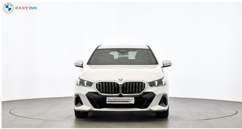
Mitglied der GADV Family