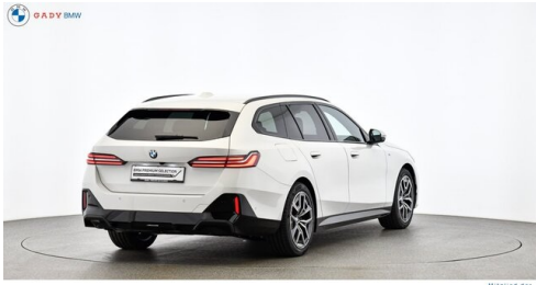
Mitglied der GADV Family