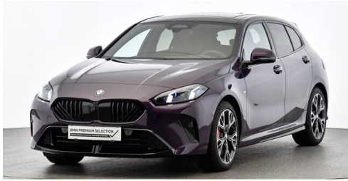
Bierbaum GmbH - Eisenstadt - www.bmw-bierbaum.at