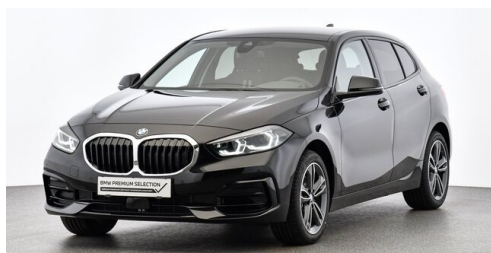
Höglinger Denzel GesmbH - Linz - www.bmw-hoeglinger.at