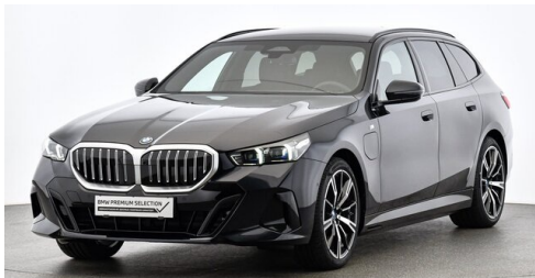
Bierbaum GmbH - Eisenstadt - www.bmw-bierbaum.at