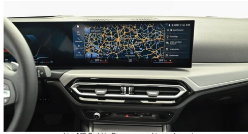
drive ME GmbH - Regau - www.driveme.bmw.at