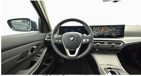
drive ME GmbH - Regau - www.driveme.bmw.at