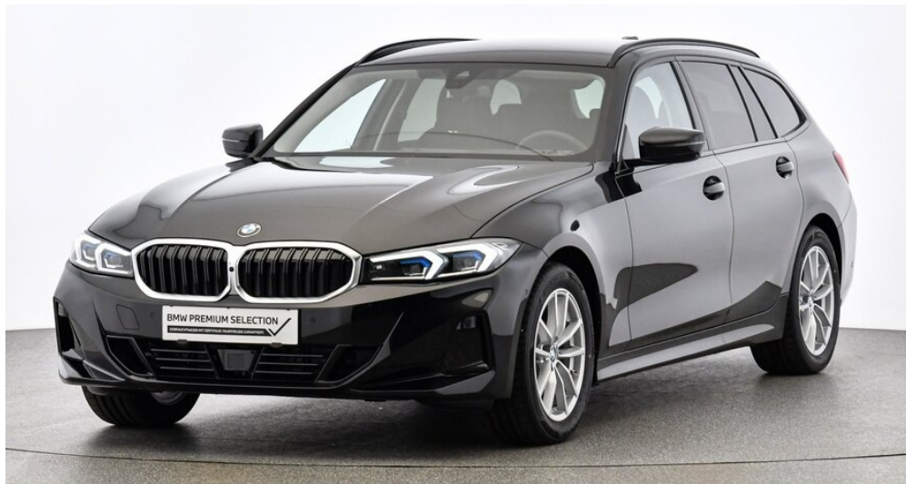
drive ME GmbH - Regau - www.driveme.bmw.at