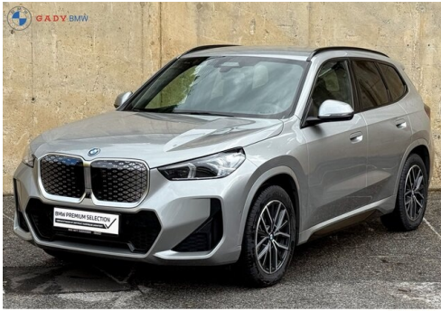
Migliori del GADY Family