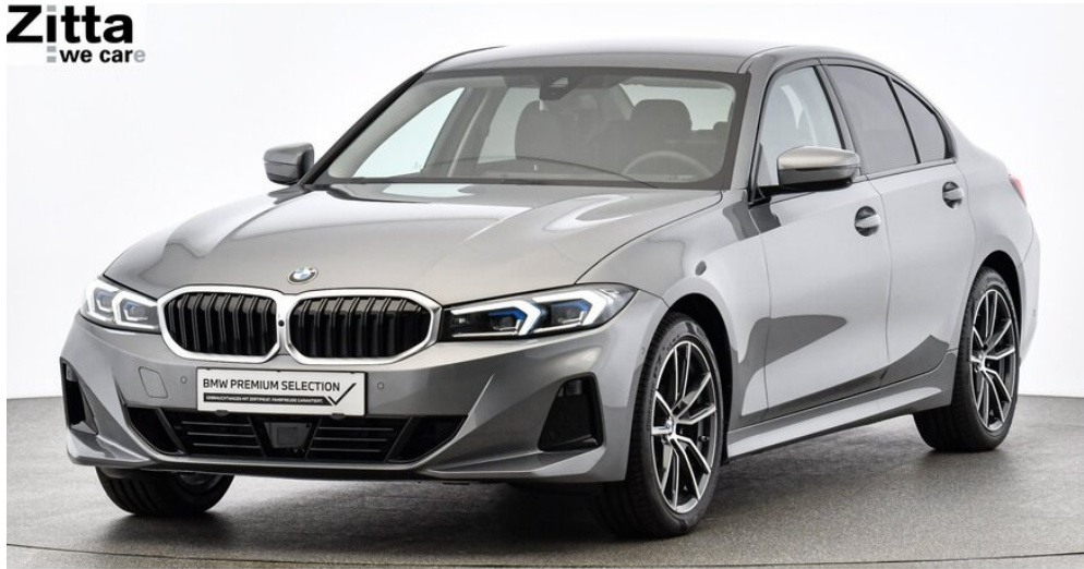
Zitta Betriebs GmbH - Perchtoldsdorf - www.zitta.at