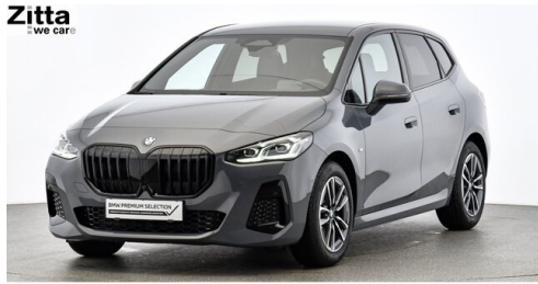
Zitta Betriebs GmbH - Perchtoldsdorf - www.zitta.at