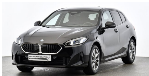
Höglinger Denzel GesmbH - Linz - www.bmw-hoeglinger.at