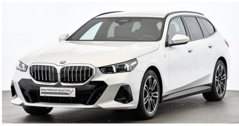
Höglinger Denzel GesmbH - Linz - www.bmw-hoeglinger.at