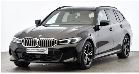
Höglinger Denzel GesmbH - Linz - www.bmw-hoeglinger.at