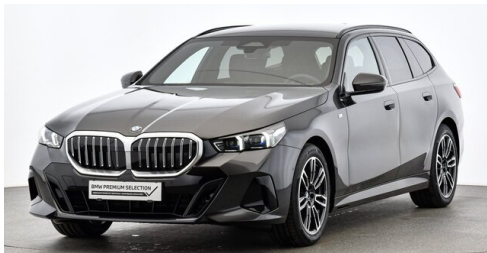
Bierbaum GmbH - Eisenstadt - www.bmw-bierbaum.at