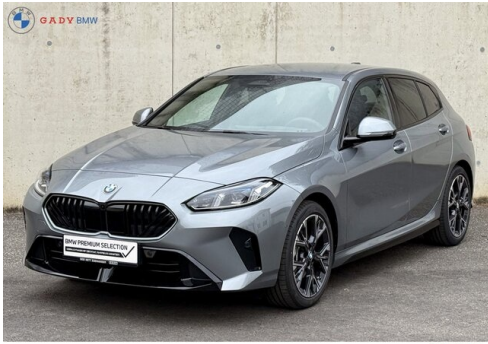
Miğlas der GADY Family