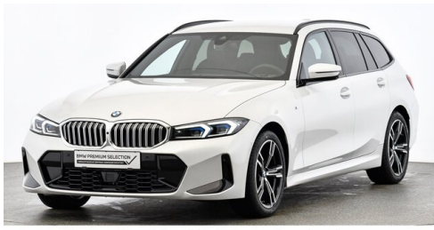
Höglinger Denzel GesmbH - Linz - www.bmw-hoeglinger.at