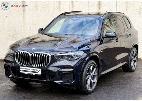
Miğlas der GADY Family