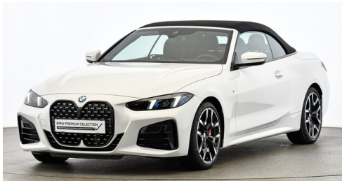
Hans Geyrhofer & Sohn GesmbH - Wels - www.geyrhofer.bmw.at