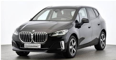
Höglinger Denzel GesmbH - Linz - www.bmw-hoeglinger.at