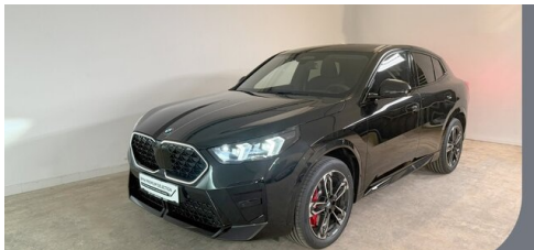
Gady Steiermark • Burgenland • Niederösterreich