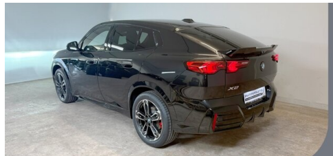
Gady Steiermark • Burgenland • Niederösterreich