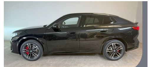
Gady Steiermark • Burgenland • Niederösterreich