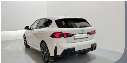
Gady Steiermark • Burgenland • Niederösterreich