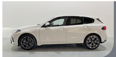
Gady Steiermark • Burgenland • Niederösterreich