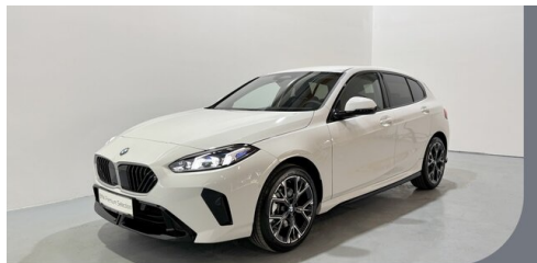
Gady Steiermark • Burgenland • Niederösterreich