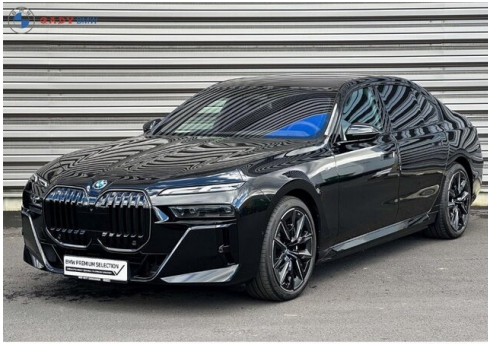
Miembros de G.A.D.V. Family