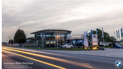
Autohaus BMW Reichhart Pergersdorfergasse 6, 1110 Mauthausen +43 37 238 2588 | www.bmw-reichhart.at