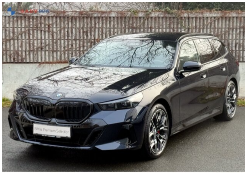
Mitglied der GADV-Familie