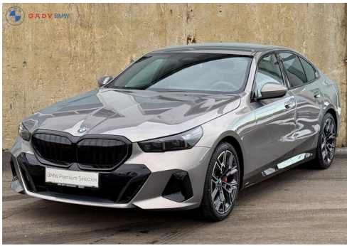
Migliore del GADY Family