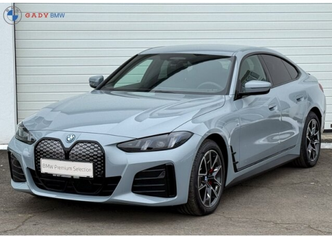
Migliorata da GADY Family