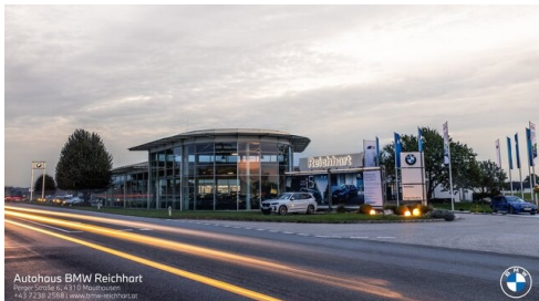
Autohaus BMW Reichhart Mauthausen 6, 4115 Mauthausen +43 2920 2588 | www.bmw-reichhart.at