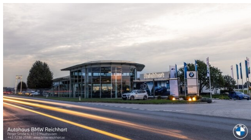
Autohaus BMW Reichhart Mauthausen 6, 4110 Mauthausen +43 29 20 20 80 | info@bmw-reichhart.at