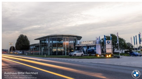
Autohaus BMW Reichhart Mauthausen 6, 4110 Mauthausen +43 2920 2588 | www.bmw-reichhart.at